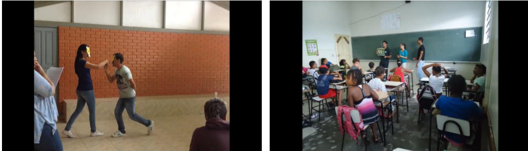
Figura 3: Projeto Teatro de Máscaras

Legenda: bolsistas apresentando teatro de máscaras; e parte da atividade “Ação na Classe”