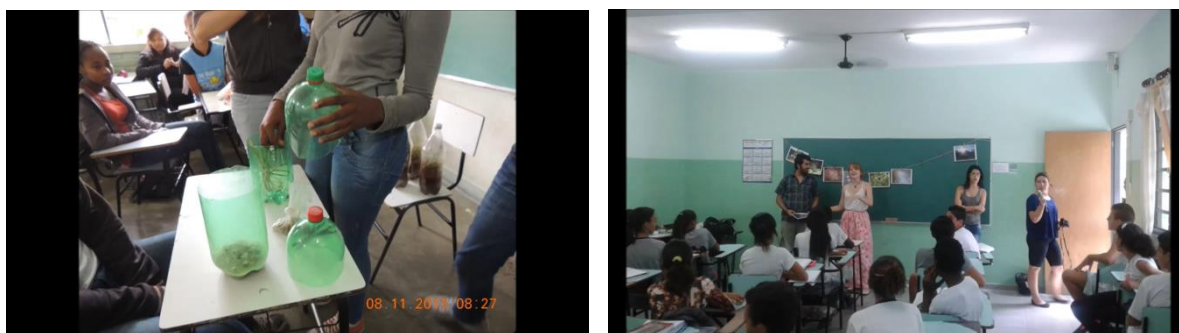
Figura 4: Projeto Terrário

Legenda: bolsistas montando os terrários em garrafas pet; exposição do varal de imagens