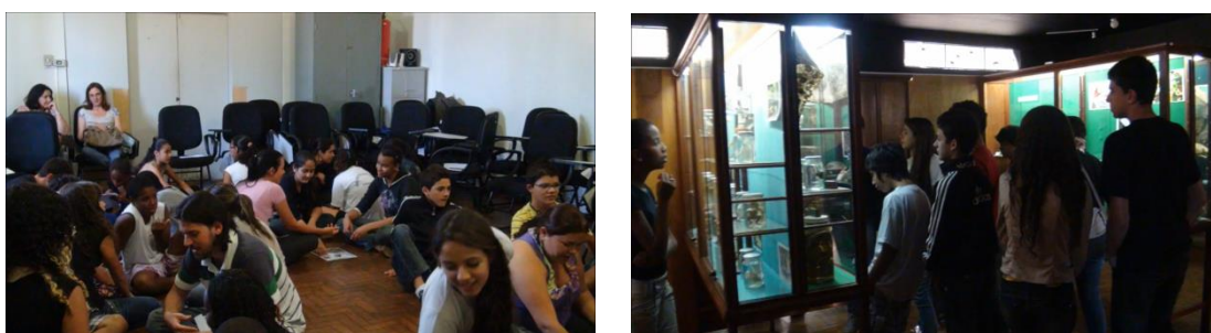
Figura 1: Projeto Museu

Legenda: bolsistas PIBID-BIO desenvolvendo parte das atividades no espaço do Museu de História Natural da UFLA.