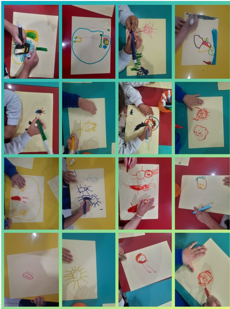
Figura 6 - Momento da atividade.