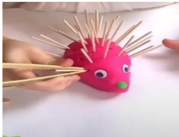
Figura 5 - Resultado do porco-espinho criado.

Com uma paleta de cores vibrantes dos materiais postos à disposição, as crianças se dedicaram à tarefa com entusiasmo. Os olhares concentrados e as mãos habilidosas trabalhavam para dar vida aos porcos-espinhos, enquanto a sala se enchia de uma energia criativa e contagiante.