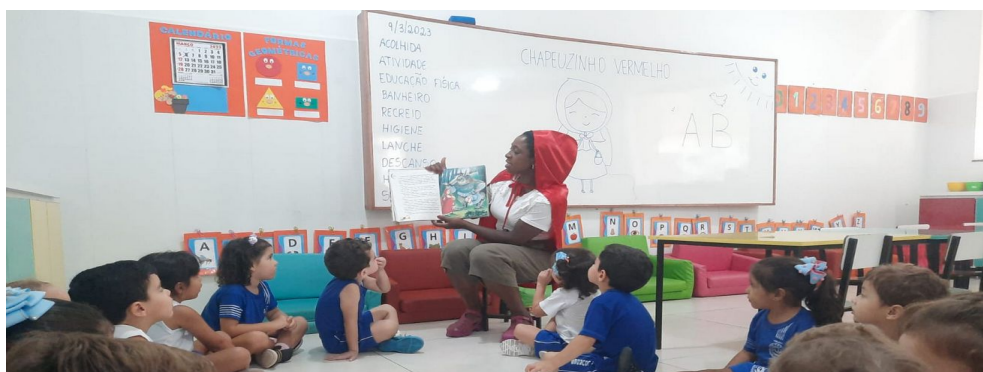
Figura 7 - Momento da contação da história.

Minha voz assumiu um tom cativante, como se estivesse contando um segredo especial apenas para eles. As palavras fluíam, carregando consigo a emoção e o suspense que permeiam a história. Cada detalhe, desde a ida da Chapeuzinho para a casa da vovó até o encontro com o lobo na floresta, foi pintado com vivacidade e entusiasmo.