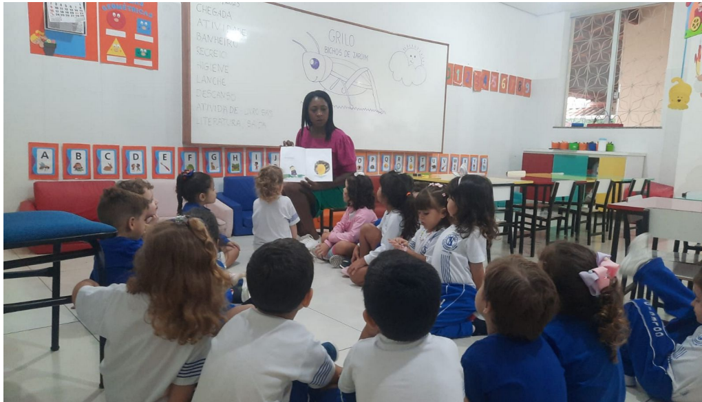
Figura 3 - Momento da contação de Histórias.

convidativo para a imersão na história. As crianças olhavam com olhares curiosos para o livro cuidadosamente segurado, prontas para serem imersas em uma jornada literária.