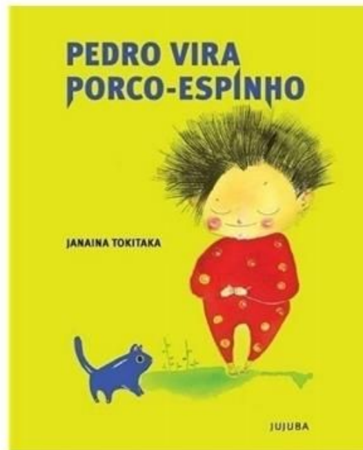
Figura 1 - Capa do “Pedro vira porco-espinho”.

A estratégia de leitura desenvolvida foi realizada a partir da obra “Pedro vira porco-espinho”, de autoria de Janaina Tokitaka (Figura 1). A obra da autora Janaina Tokitaka aborda a intrigante questão das emoções e sentimentos que todos nós experienciamos. O livro convida os leitores a explorarem as complexidades das emoções humanas, questionando de forma lúdica e cativante os processos que desencadeiam diferentes estados emocionais.