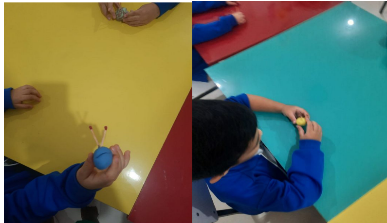
Figura 4 - Processo de criação do porco-espinho pelas crianças.