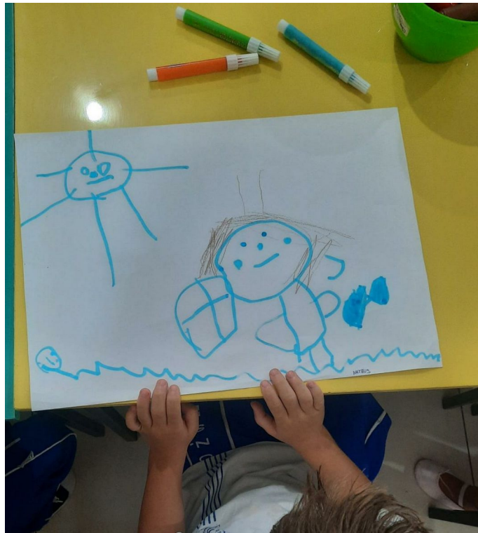
Figura 8 - Momento da aplicação da atividade.