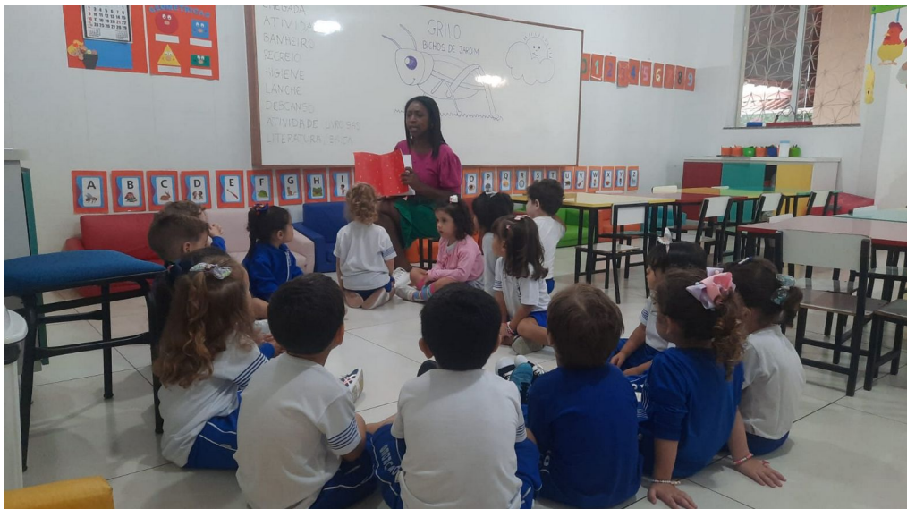
Figura 2 - Momento da contação de histórias.

Após o momento de acolhida, foi realizada a leitura do livro: Pedro vira porco espinho de Janaina Tokitaka. Após o acolhimento caloroso, foi chegada a hora aguardada: a leitura do livro "Pedro vira porco-espinho", da autora Janaina Tokitaka. Com as crianças acomodadas em seus lugares, ansiosas por descobrir as aventuras de Pedro, a atmosfera estava carregada de expectativa e empolgação (Figuras 2 e 3).