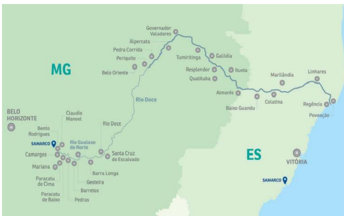
Figura 3 - Caminho percorrido pelos rejeitos da Samarco

(CALIXTO, 2015) e por matar 19 pessoas, sendo elas, trabalhadoras da Samarco e moradores das regiões diretamente afetadas (G1, 2016a). Ademais, a lama de rejeitos lançada chegou a uma altura de 15 metros em Bento Rodrigues (distrito de Mariana-MG), arrastando veículos, cobrindo telhados, deixando pessoas soterradas, ilhadas, o distrito em condições inviáveis para habitação e sobrevivência e mais de 1.200 pessoas desabrigadas (G1, 2015c). Além de Bento Rodrigues, a lama chegou a afetar também as regiões de Águas Claras, Ponte do Gama, Paracatu e Pedras e as cidades de Barra Longa e Rio Doce. Os rejeitos da barragem também atingiram cidades da Região Leste do estado de Minas Gerais e o Espírito Santo (G1, 2015c). O caminho percorrido pelos rejeitos de Fundão (Figura 1) iniciou pelo distrito marianense, Bento Rodrigues, até Regência, Espírito Santo aonde chegou ao Oceano Atlântico.