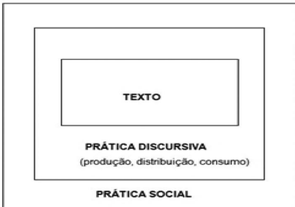
Figura 1 - Modelo tridimensional da análise crítica do discurso de Fairclough