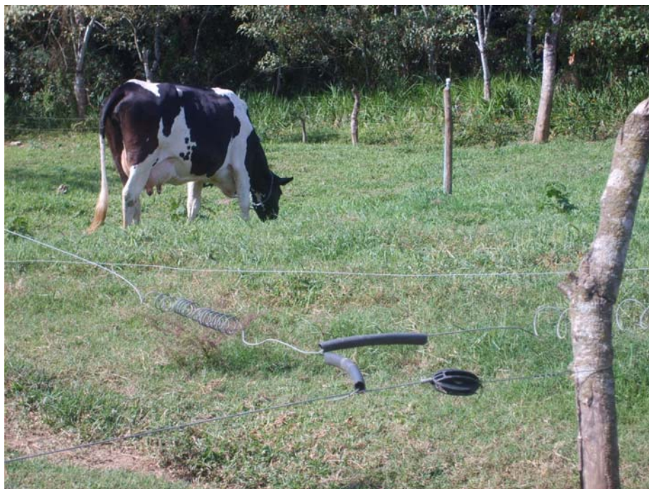
Figura 11 Divisão de piquetes com cerca elétrica e aproveitamento de materiais disponíveis na propriedade: pedaço de mangueira de plástico como isolador e galho de arbusto nativo como haste

É oportuno ressaltar que, por trás da aparente simplicidade das tecnologias utilizadas no Projeto Balde Cheio em Lima Duarte, há um grande aporte tecnológico de pesquisas científicas testadas e validadas em diferentes regiões do país, desenvolvido por universidades, centros de pesquisa e difusão de tecnologias, além de órgãos de extensão rural.