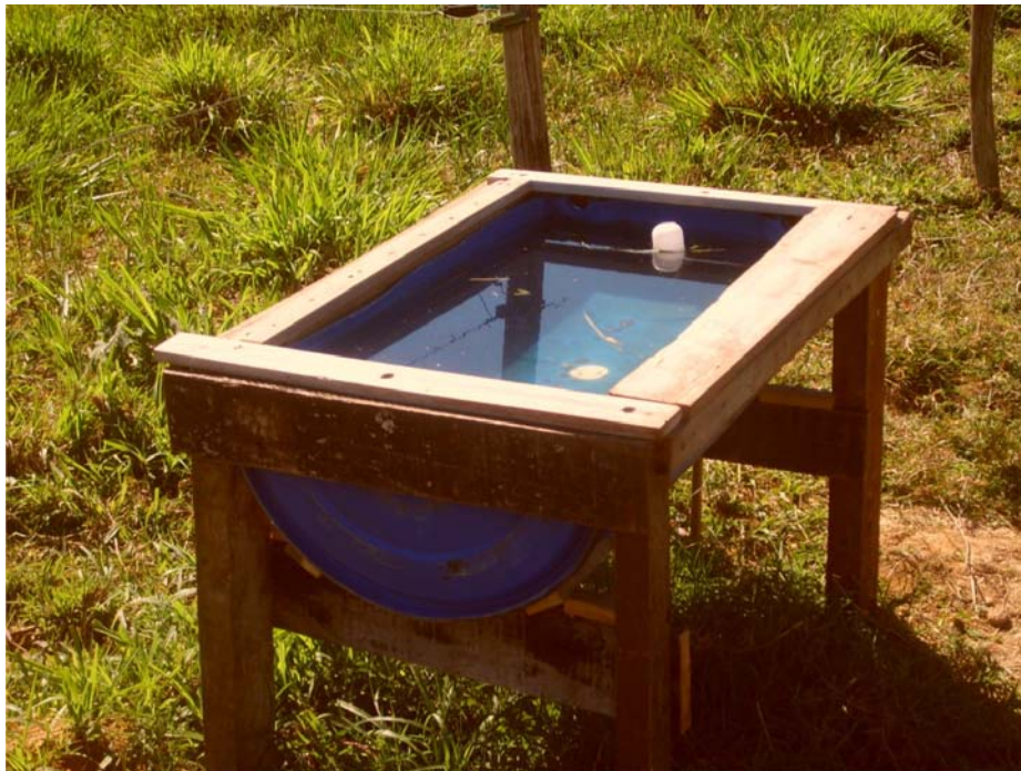
Figura 10 Tambor de plástico adaptado como bebedouro, em ponto estratégico da propriedade leiteira

A utilização da tecnologia destacada na Figura 10 visa evitar que os animais se desloquem a grandes distâncias para beber água, minimizando assim gastos de energia desnecessários, proporcionando maior conforto aos animais e melhora nos índices de produção.