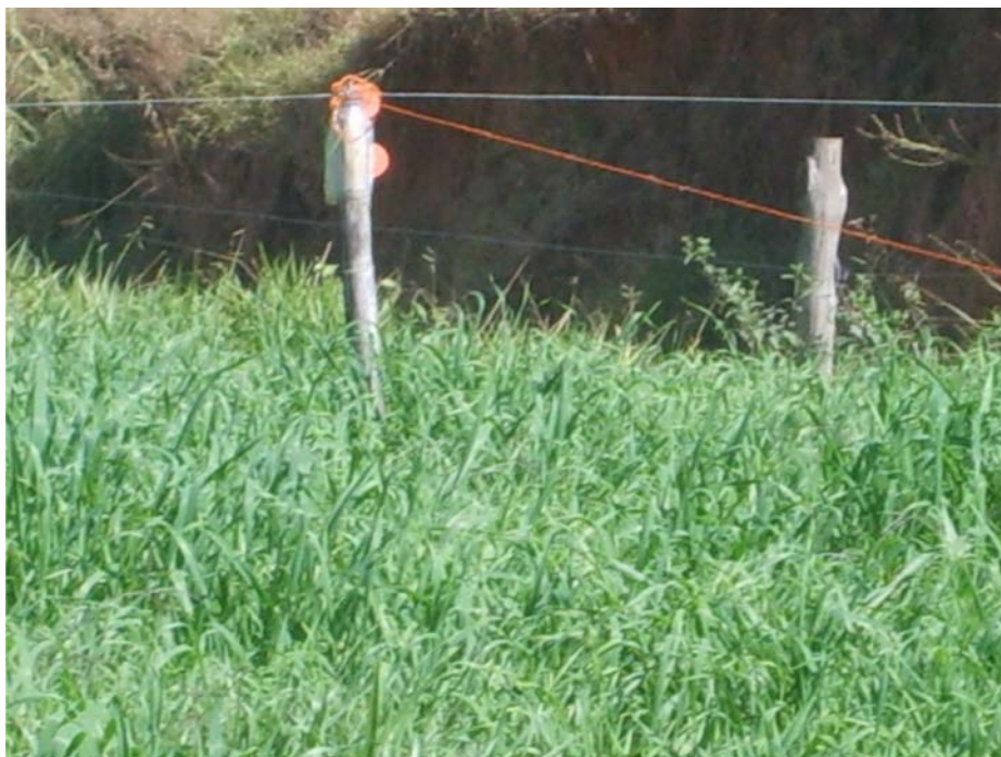
Figura 8 Pastejo diferido: 1/3 do piquete é disponibilizado durante o período da manhã e 2/3 no período tarde/noite

Durante as visitas realizadas às propriedades integrantes do Projeto Balde Cheio em Lima Duarte, observou-se, por meio do relato dos técnicos extensionistas locais e dos produtores participantes, preocupação em seguir um cronograma previamente agendado para a implantação dos procedimentos tecnológicos a serem desenvolvidos. Assim sendo, evidencia-se um minucioso trabalho de planejamento e gestão da propriedade leiteira, para que os resultados possam ser atingidos e mais bem avaliados em relação às metas previamente estipuladas para cada fase do Projeto.