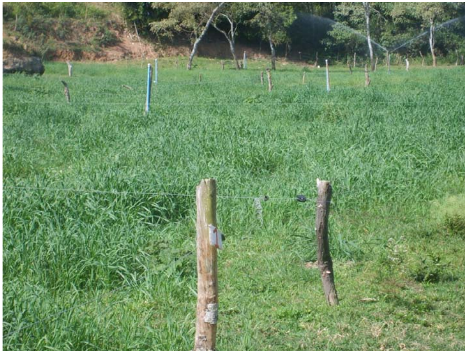
Figura 7 Divisão da área intensificada em piquetes rotacionados, irrigação da área com sobressemeadura de aveia em pastagem de grama-estrela ( Cynodon Plectostachyus e C. nlemfuensis ) para aumento da capacidade de suporte da pastagem nos meses de inverno - pastejo de inverno

Na Figura 8 visualiza-se a racionalização do uso dos piquetes por meio de um fio eletrificado dividindo o piquete em três partes.