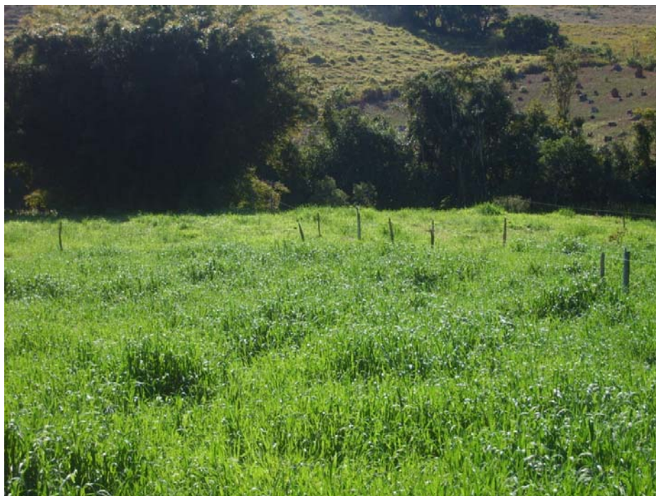
Figura 6 Área de várzea intensificada na produção de alimentos volumosos, com preservação da mata ciliar ao fundo

Observa-se, na Figura 7, a utilização da irrigação na área intensificada e a sobressemeadura de forrageiras de inverno, com a finalidade de aumentar a capacidade de suporte da pastagem.