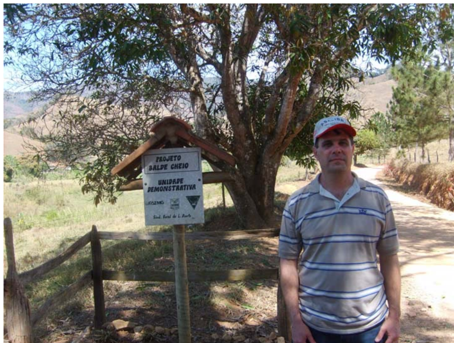
Figura 4 Placa da Unidade Demonstrativa do Projeto Balde Cheio (UD) no município de Lima Duarte, MG, Fazenda Casinha

Sobre as mudanças ocorridas na propriedade, devido aos procedimentos metodológicos de transferência de tecnologia utilizados pelo projeto Balde Cheio no município, o filho do proprietário destacou o seguinte: