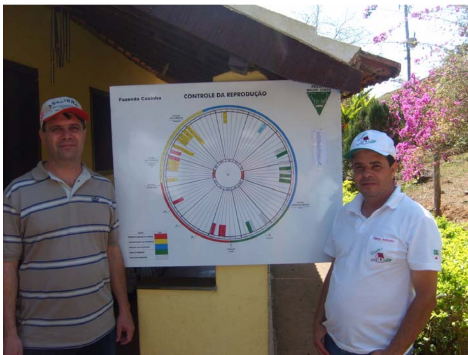
Figura 5 Quadro circular dinâmico de gerenciamento reprodutivo da Fazenda Casinha

que é o quadro circular dinâmico de gerenciamento reprodutivo da Fazenda Casinha.