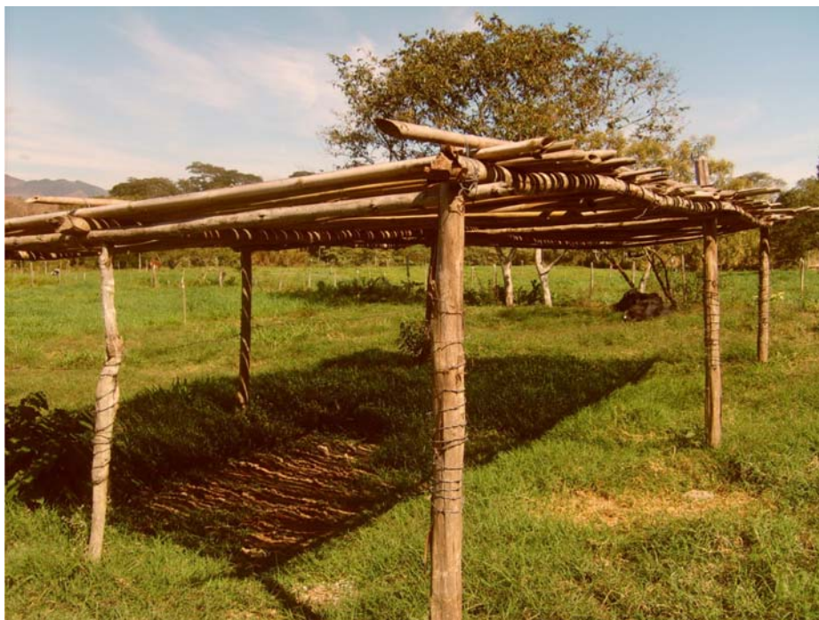
Figura 9 Área de descanso com cobertura de bambu (sombreamento artificial)

A instalação apresentada na Figura 9 foi erguida com os objetivos de reduzir do estresse térmico, melhorar a produção de leite e minimizar os efeitos do calor na produção e na reprodução das vacas leiteiras. Esta instalação é construída no sentido norte-sul, de maneira que os raios solares estejam sempre atingindo a área sombreada, evitando o acúmulo de umidade, que pode causar desconforto e doenças nos animais. A altura de pé-direito mínima é de 3,5 m, a fim de proporcionar uma melhor troca térmica entre os animais sob o abrigo e o meio ambiente, além de dissipar melhor a irradiação solar sobre a cobertura da instalação.