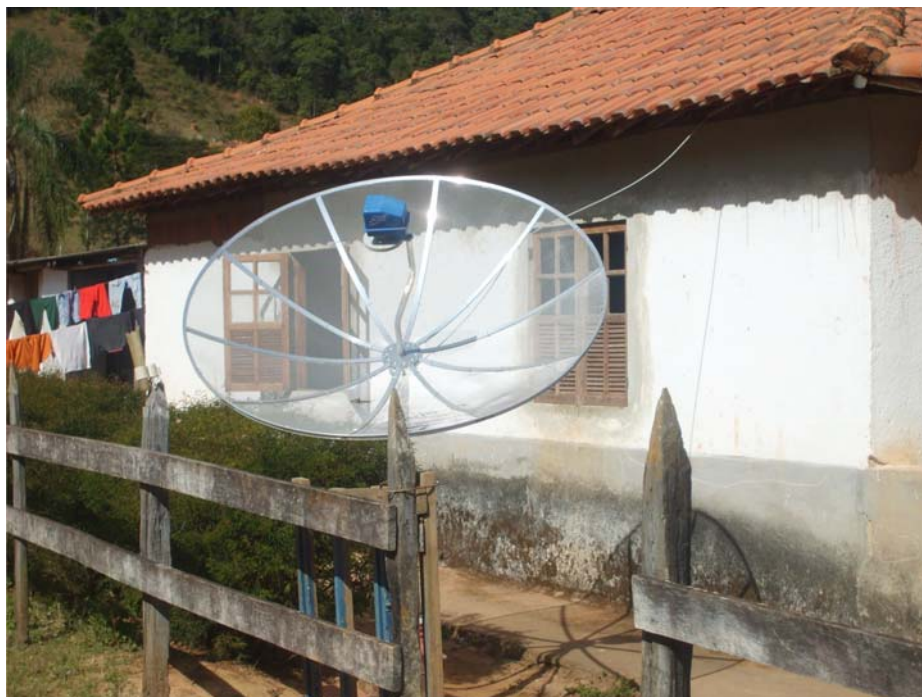
Figura 12 Melhora da qualidade de vida do produtor e sua família

À medida que os resultados vão aparecendo, os produtores sentem-se mais confiantes e motivados a continuar no Projeto Balde Cheio. A geração de renda proporcionada pela correta utilização dos conceitos de produção intensiva e sustentável de leite reflete na melhora do padrão de vida e na recuperação da autoestima dos produtores, conforme relataram alguns deles, durante a realização das entrevistas.