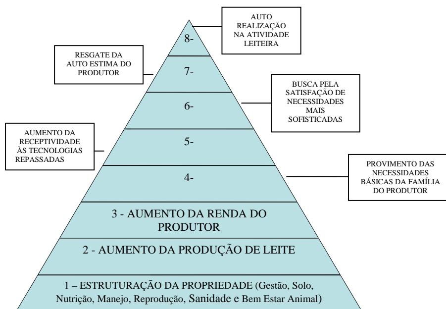
Figura 3 Efeito da estruturação da propriedade, no aumento da produção de leite e na receptividade do produtor às tecnologias propostas no Projeto Balde Cheio.

Na Figura 3 abaixo, esta sequência pode ser mais bem compreendida.