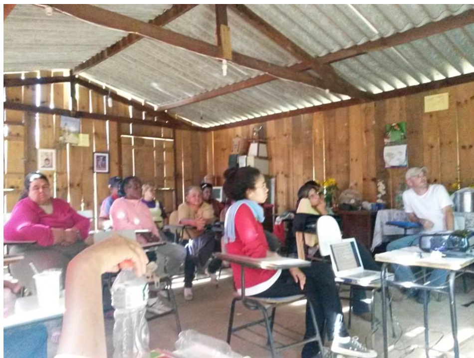
Foto 1. Reunião com o grupo Olhos D'água no dia 16 de maio de 2015. Apresentação da proposta de pesquisa. Assentamento Santo Dias.

Nesse sentido, ressaltamos que, a articulação de vários métodos de obtenção de informações tem como objetivo não considerar as “fontes de informações” homogêneas e lineares. Captar as especificidades e diferentes estratégias de resistência e autonomia representou um desafio perseguido no trabalho. As “fontes de informações” são mulheres com história e sujeitas ativas no processo de desenvolvimento da pesquisa.