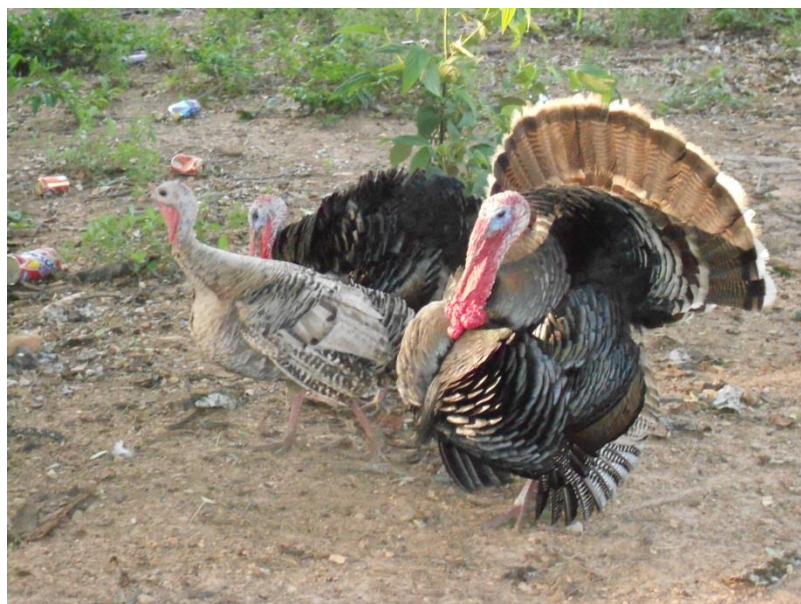
Foto 4. Animais da mulher que aguarda liberação do lote. Assentamento Santo Dias.