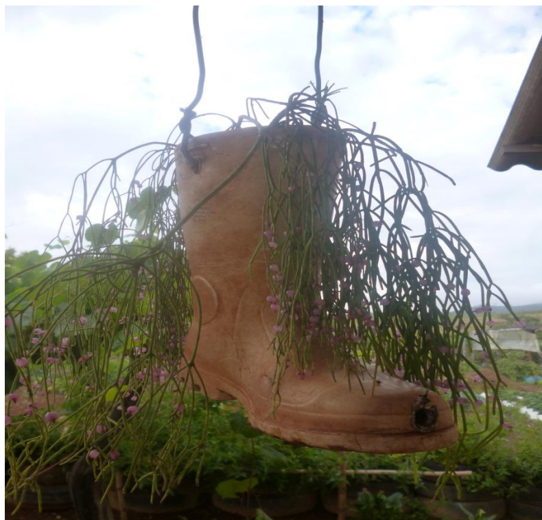
Foto 9. Vista da área externa da casa de uma assentada, onde pode ser percebido o reaproveitamento de uma botina, já imprópria para o trabalho, e de pneus para “segurar” a terra.

Importante dizer que estamos tratando aqui de agricultoras, assentadas de reforma agrária, negras, mães, avós, tias, sobrinhas, afilhadas e filhas, donas de casa, militantes, estudantes, enfim, o que queremos mostrar é a diversidade das atividades desempenhadas por elas em várias frentes. As universidades, políticas públicas e movimentos sociais devem cada vez mais ampliar as lentes para estas especificidades, riquezas sociais e ambientais e ao mesmo tempo complexidades que precisam ser enfrentadas cada vez mais fortemente.