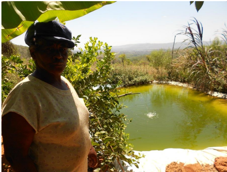
Foto 6. Vista de um lago artificial para criação de peixes no lote de uma assentada. Assentamento Santo Dias.

A literatura tem se pronunciado acerca da diversidade, de plantas e animais, priorizada pela agricultura familiar, e do uso sustentável da terra, e mais especificamente, dos quintais, que as mulheres vêm realizando ao longo dos tempos. Esse quadro ficou evidente nos lotes das mulheres no Santo Dias, onde ao lado de culturas de café, haviam hortas, animais, inclusive a criação de lagos artificiais para criação de peixes. Além da reutilização de alguns materiais que de outro modo teriam engrossado as montanhas de lixo em algum lixão. Tudo isso muito bem harmonizado e sublinhado pelo toque dessas mulheres 19 .