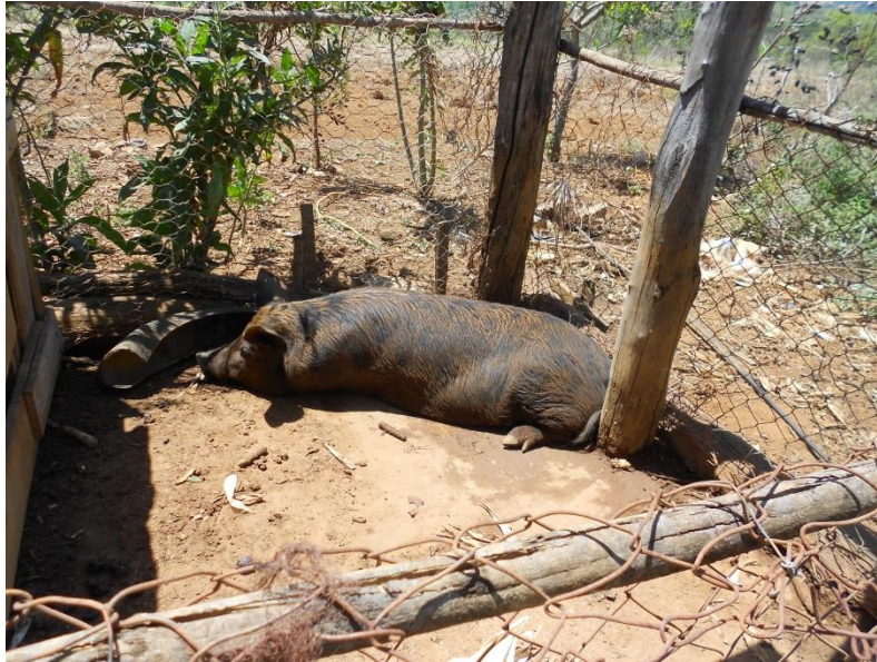
Foto 7. Porco em chiqueiro provisório no lote de uma assentada. Assentamento Santo Dias.