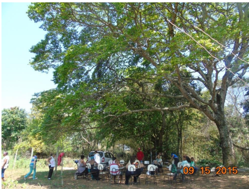
Foto 2. Grupo focal. Assentamento Santo Dias, 15 de set. de 2015.