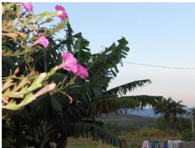
Foto 3. Vista do quintal de uma das assentadas. Assentamento Santo Dias.

Das observações que fizemos a respeito dos cuidados com o lote, que diz muito sobre a apropriação daquele espaço pelo (a) sujeito (a), ficaram nítidos os traços e impressões deixados pelas mulheres. Na utilização que elas fazem dos lotes, mesmo nos espaços destinados a horta ou a produção de outras culturas, é possível perceber alguns cuidados muito particulares, entre eles, a presença marcante de flores, pequenos animais (os cães têm especial espaço), frutas e outros mimos que marcam de forma indelével o lote.