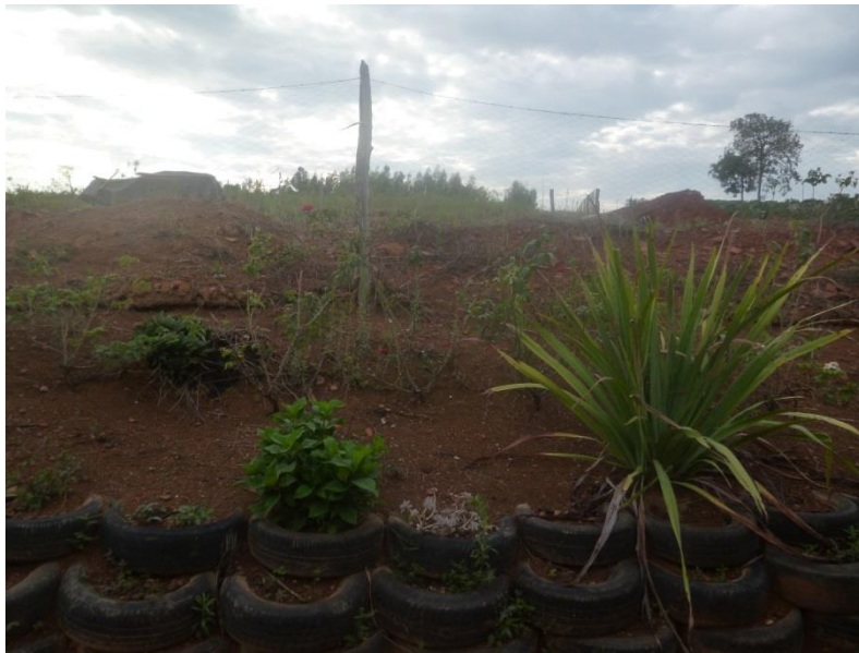
Foto 8. Vista do lote de uma assentada, em que foram reutilizados pneus na contenção de terra. Assentamento Santo Dias.